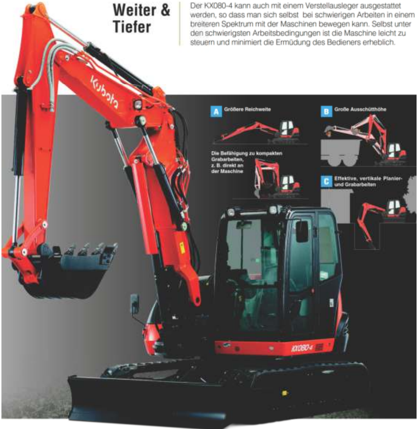
A Größere Reichweite

Der KX080-4 kann auch mit einem Verstellausleger ausgestattet werden, so dass man sich selbst bei schwierigen Arbeiten in einem breiteren Spektrum mit der Maschine bewegen kann. Selbst unter den schwierigsten Arbeitsbedingungen ist die Maschine leicht zu steuern und minimiert die Ermüdung des Bedieners erheblich.