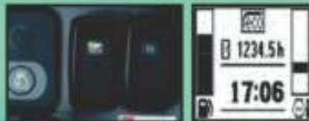
ECO PLUS / AI - Ausschalter ECO PLUS - Anzeige

Bei Normalbetrieb im Standard - Modus (ECO Plus) spart der KX080-4 bis zu 18% Kraftstoff gegenüber dem Vorgängermodell. Für den harten Grabelinsatz steht der Power Mode zur Verfügung, dieser ermöglicht eine ca. 5% höhere Leistung der Produktivität gegenüber dem Vorgängermodell und senkt den Kraftstoffverbrauch um bis zu 12%.